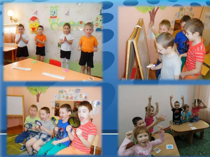
Проведение подгрупповых занятий