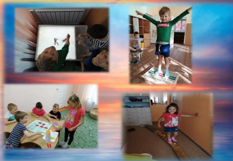
Использование современных пед. технологий