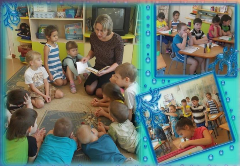
Групповые занятия по подготовке детей к школе