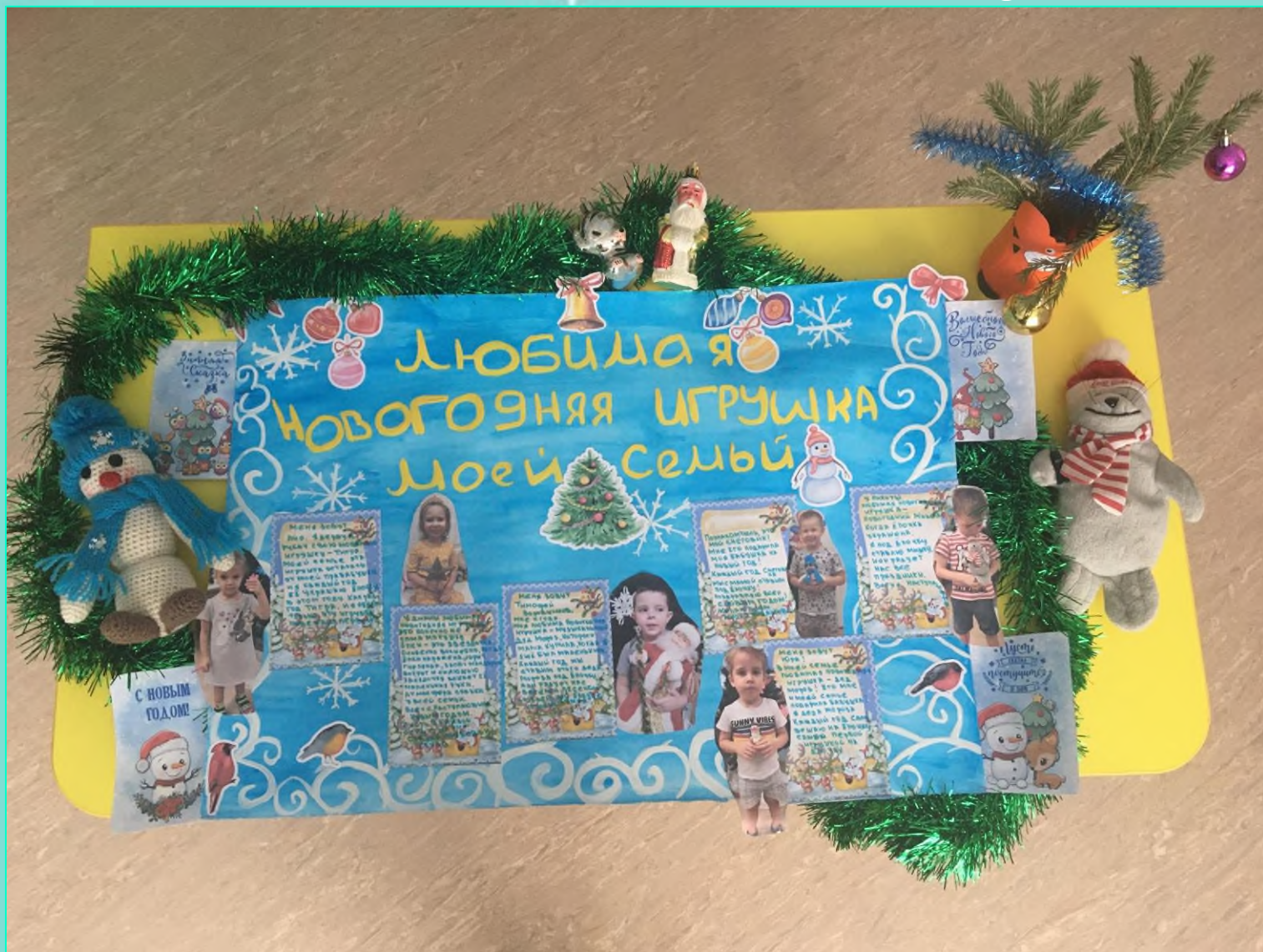
Средняя группа «Незабудка»