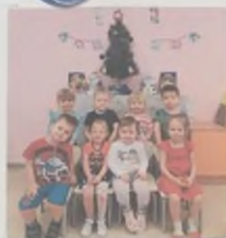
Мы ребята из группы Одуванчик. Эта наша первый Новый год в детском саду. И мы в первый раз все вместе нарядили нашу елочку. Это будет наш первый и самый новогодний традицией! Желаю всем здоровья, радости и добра!