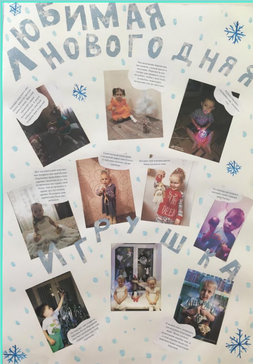
Вторая группа раннего возраста «Зайчата»